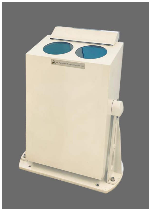
Рисунок 1 – Общий вид датчиков ДНГО-8